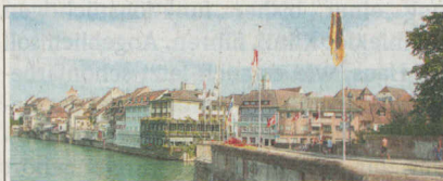
BLICK ÜBER DEN RHEIN

Das Hotel Schützen ist ein Geschäftsfeld der Schützen Rheinfelden AG, zu der auch das Hotel Eden im Park, das Hotel Schiff am Rhein (ab dem 1. Januar 2012) und die in das Hotel integrierte Klinik gehören. Das Dreisterne-Hotel bietet 33