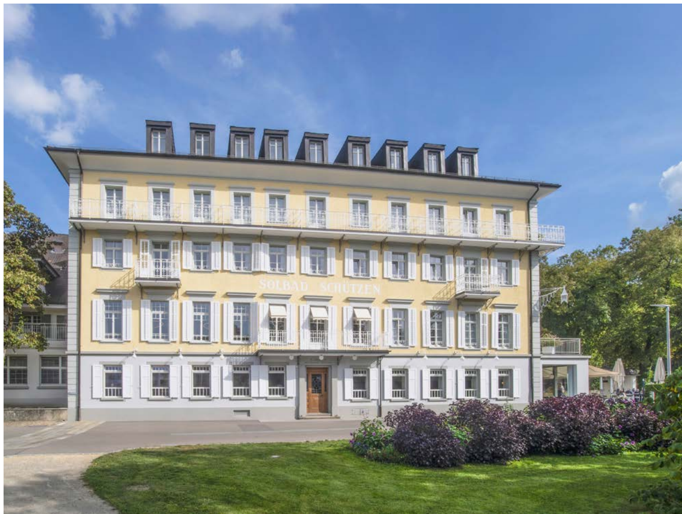
Hotel Schützen Rheinfelden