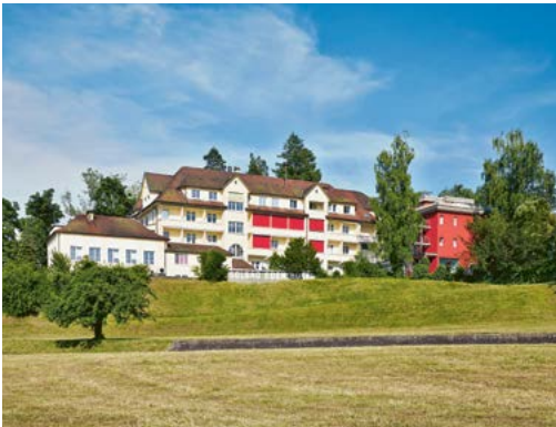
Hotel Eden im Park