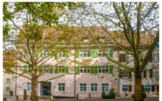
Häuser an der Martinsgasse