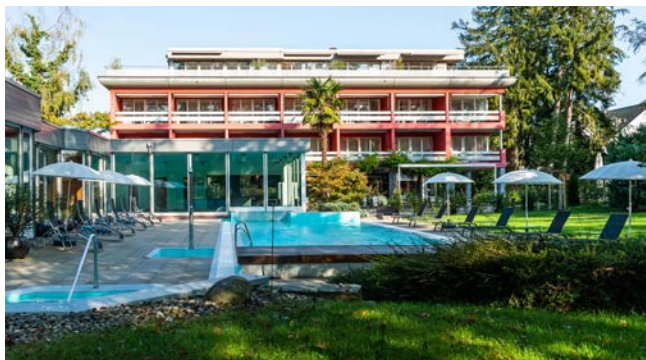
Eden im Park